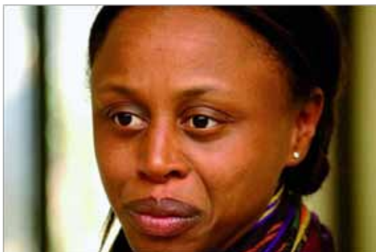
© Droits réservés - Dyana Gaye